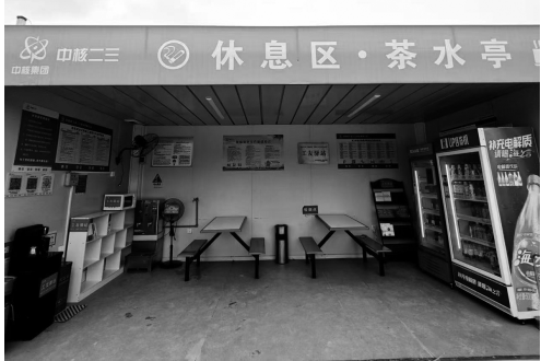
重庆市渝北区“工友驿站”投入使用

渝北区总工会相关负责人介绍,“工友驿站”并非“一次性投入”的便民设施,而是长期服务建筑工人的起点。未来,渝北区总工会将持续加强驿站的日常管理与服务优化,并计划进一步拓展健康义诊、技能培训等服务内容,让驿站真正成为连接工会与工友的“连心桥”,切实提升一线建筑工人的获得感与幸福感。